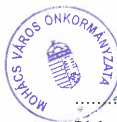
..... Pávkovics Gábor Polgármester